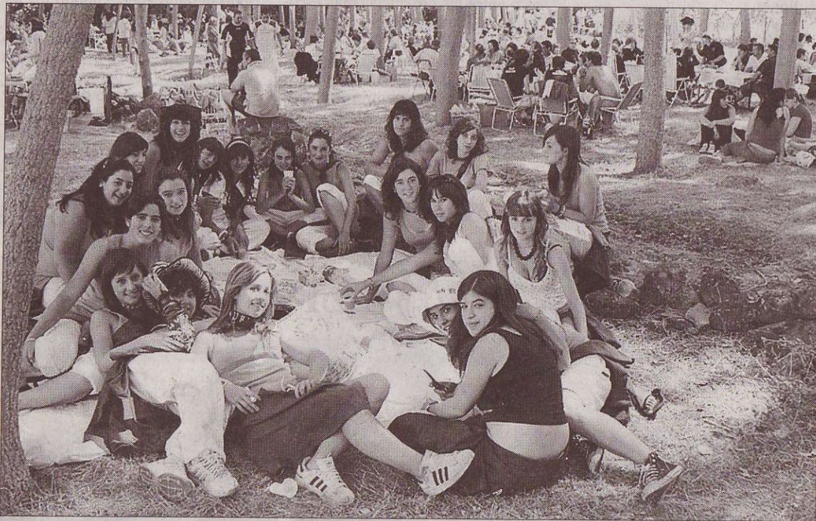
Los peñistas se reunieron en torno a un guiso de carne y patatas en un paraje cercano a Salas.

Seguro que durante la larga sobremesa, que alcanzó hasta cerca de las ocho de la tarde, los comentarios más extendidos estuvieron relacionados con el escándalo acaecido en la plaza de toros el día de San Roque, cuando se tuvo que suspender la novillada de rejones, cuando sólo se había desarrollado la mitad de los festejos, ante la falta de caballistas.