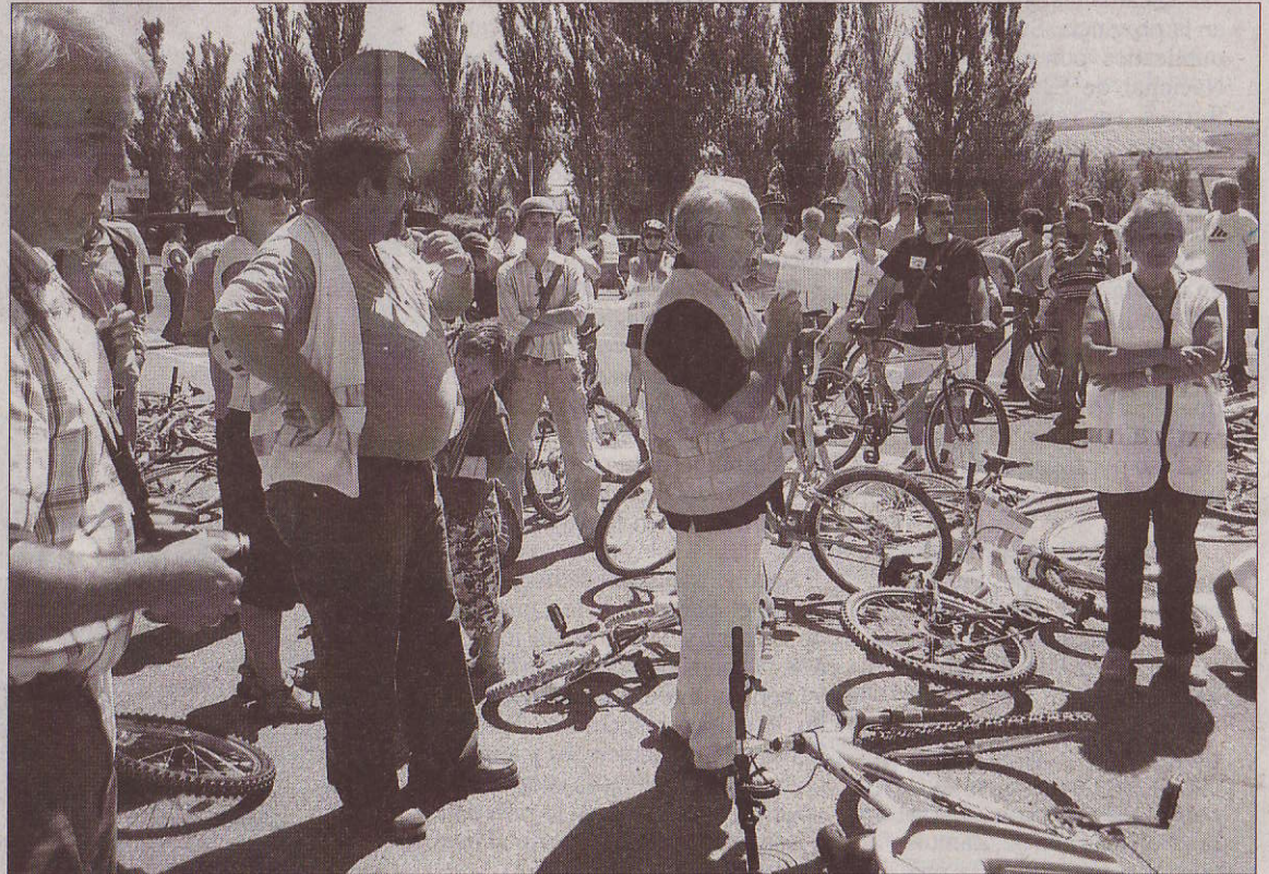
Decenas de manifestantes hicieron el camino en bicicleta y en coche entre Villadiego y el cruce con la N-120.

Lo que pretenden los vecinos de la comarca de Villadiego es «que se arregle ya» y que las administraciones locales -Diputación Provincial de Burgos- y la Junta de Castilla y León «se moien» v em-