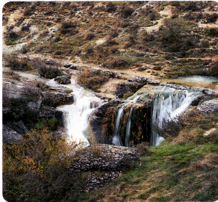
A la izquierda, la Fuente Manapites. A la derecha, una vista de la cascada de La Yeguamea.

EL RÍO ODRÁ, MODESTO AFLUENTE DEL PISUERGA, TIENE SUS FUENTES EN EL MISMÍSIMO CORAZÓN DE LAS LORAS